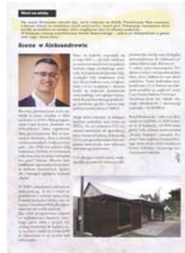
Ilustracja 14 – Artykuł w biuletynie „Straszyn - nasze miejsce” nr 1, wrzesień 2021 r.

Sołectwo prowadzi także swoją „kronikę” w postaci strony internetowej pod adresem: https://www.aleksandrowo.pl oraz posiada profil w mediach społecznościowych, gdzie na bieżąco opisywane są sprawy dotyczące wsi: https://www.facebook.com/solectwo.aleksandrowo .