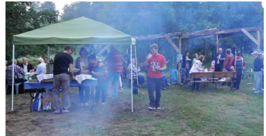
Ilustracja 16 – Pierwsze spotkanie integracyjne mieszkańców Aleksandrowa połączone z kinem plenerowym na Placu Wiejskim, 6.08.2016 r.