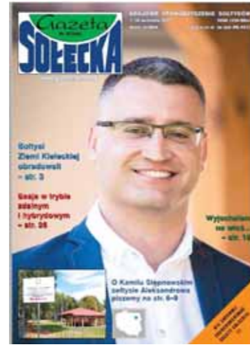
Ilustracja 13 – Okładka „Gazety Sołeckiej” nr 9 (345), wrzesień 2021 r.