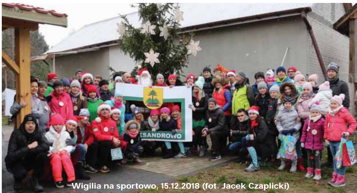
Wigilia na sportowo, 15.12.2018