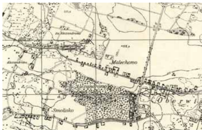
Ilustracja 11 – Fragment wojskowej mapy Rzeszy Niemieckiej 1 : 25 000 z 1941 r. z naniesioną wsią Aleksandrowo