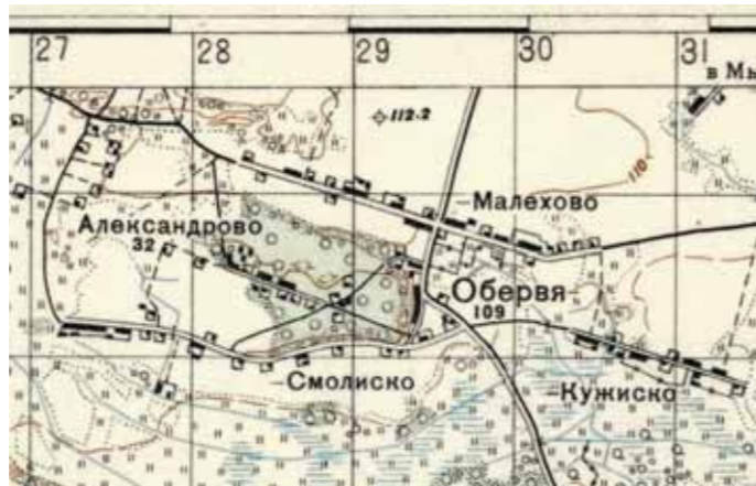
Ilustracja 10 – Fragment wojskowej mapy Armii Czerwonej 1 : 21 000 z 1941 r. z naniesioną wsią Aleksandrowo