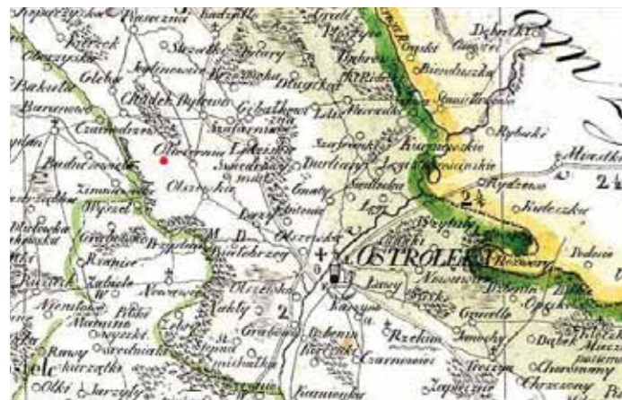
Ilustracja 2 – Fragment mapy Królestwa Polskiego z 1827 r.