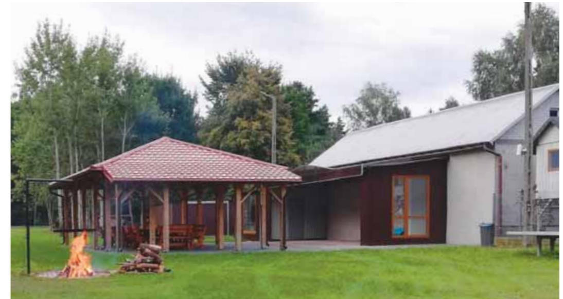
Ilustracja 15 – Plac Wiejski, sierpień 2021 r.