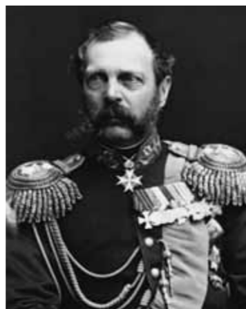
Ilustracja 3 – Aleksander II Romanow, cesarz Wszechrusi, król Polski i wielki książę Finlandii