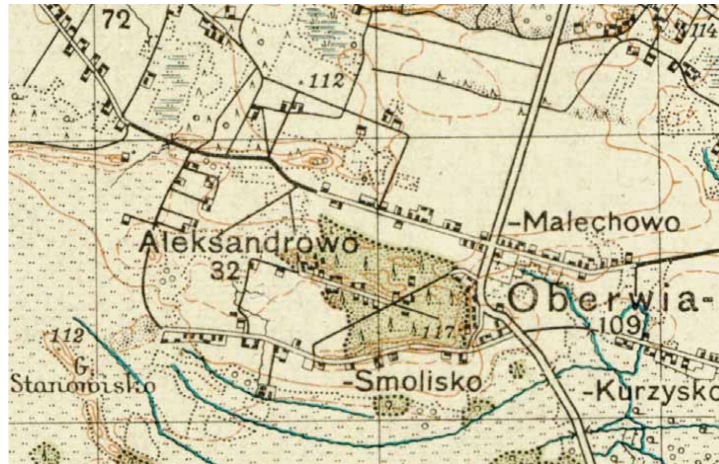
Ilustracja 8 – Fragment wojskowej mapy 1:100 000 z 1932 r. z naniesioną wsią Aleksandrowo