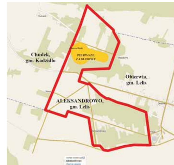
Ilustracja 1 – Współczesne Aleksandrowo z zaznaczonym miejscem pierwszych zabudowań

mię na własność. Podstawowym jej celem było odciążenie mas chłopskich od powstania, odsetek bowiem bezrolnych mieszkańców wsi na terenie powiatu ostrołęckiego wynosił w tym czasie aż 54,7%. Po powstaniu styczniowym władze carskie wprowadziły także nowy podział administracyjny kraju, w wyniku którego utworzono gubernię łomżyńską. Jednym z 9 powiatów był powiat ostrołęcki, w skład którego weszły gminy: Czerwin, Dylewo, Goworowo, Myszyniec, Nakły, Nasiadki, Piski, Rzekuń, Szczawin, Troczyn i Wach 4 .